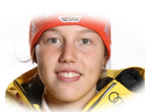
LAURA DAHLMEIER edukas laskesuusataja