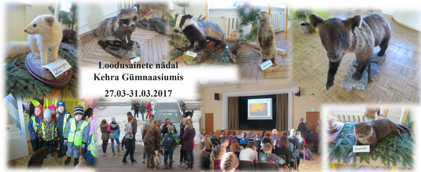
Loodusainete nädal Kehra Gümnaasiumis 27.03-31.03.2017

Loodusainete nädalat kajastas ka ajaleht „Sõnumitooja“ oma 14 numbris, mis ilmus 5.04.2017.