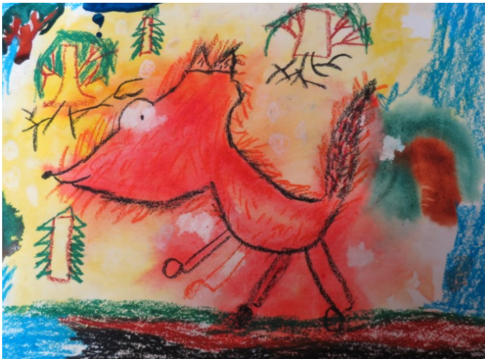
1.c klassi ahvinäitus