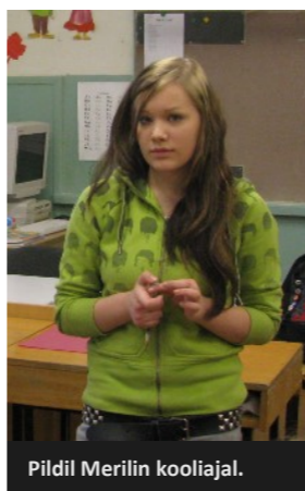
Pildil Merilin kooliajal.