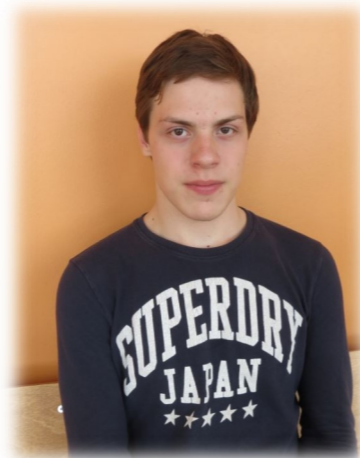
Hans Otto Pool 11. klass

Soovitan koduõpet inimestele, kes saavad iseseisvalt õppimisega hästi hakkama.