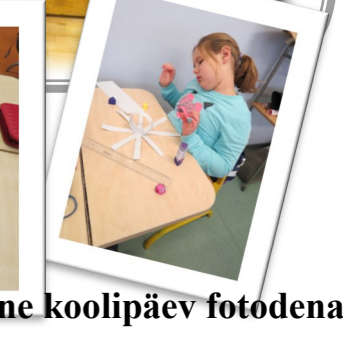
Tavapärase koolipäev fotodena