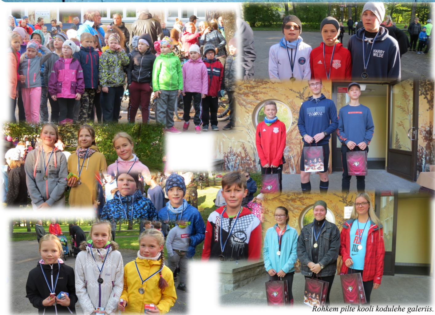
Rohkem pilte kooli kodulehe galeriis.