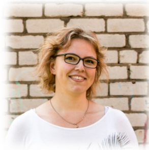
Anname sõna noormeestele!

Saame rohkem teada oma kooli meesõpetajast!